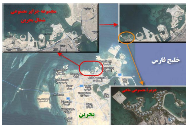
نقشه (۴): جزایر مصنوعی شمال شرقی بحرین (امواج، المحرق و دلمونیا)، جنوب شرقی بحرین (دیورات)، شمال بحرین (ماهی)؛ (عابدی‌درچه و براتی، ۱۳۹۳)