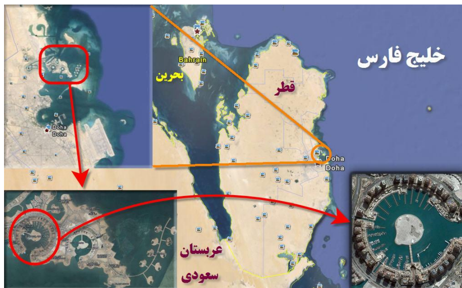
نقشه (۵): جزیره مصنوعی مروارید قطر، (عابدی‌درچه و براتی، ۱۳۹۳)

کشور قطر نیز در حال ساخت مجمع‌الجزایر مصنوعی به فاصله ۳۵۰ متر از سواحل خود است. جزایر مروارید قطر، تا ۴ کیلومتر مربع گسترش خواهد یافت و مسکن ۳۰۰۰۰ نفر را تامین خواهد