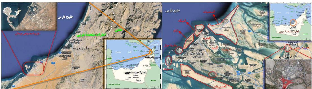
نقشه (۳): جزایر مصنوعی رأس الخیمه و ابوظبی در امارات، (عابدی درچه و براتی، ۱۳۹۳)

دورادور آن احداث گردید. وقتی از پالم جبل علی به سمت شمال در سواحل دوی حرکت کنیم، به پالم یا نخیل جمیرا اولین قسمت از پروژه نخیل که در سال ۲۰۰۲ شروع شد، می‌رسیم. این پالم به طول ۵/۲ و عرض ۴/۹ کیلومتر و مساحتی حدود ۲۰ کیلومتر مربع احداث شده است. پس از آن مجمع‌الجزایر العالم یا جهان به شکل بیضی با یک حصار سدی جهت حفاظت از آن با طول ۹/۳ و عرض ۷/۴ ساخته شده که اخیراً طرحی در حاشیه