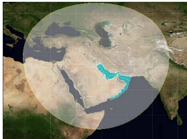
نقشه (۱): محدوده مسئولیت رایمی در حاشیه خلیج فارس، دریای عمان و اقیانوس هند (ترسیم: نگارندگان)

می‌باشند (مستوفی‌الممالکی و گورانی، ۱۳۸۸). بر اساس ماده دوم کنوانسیون منطقه‌ای کویت، گسترش منطقه دریایی رایمی (۵) به ترتیب بین عرض‌های جغرافیایی و طول‌های جغرافیای زیر تعریف می‌شود: ۱۶ درجه و ۳۹ دقیقه شمالی تا ۵۳ درجه و ۳ دقیقه و ۳۰ ثانیه شرقی؛ ۱۶ درجه شمالی تا ۵۳ درجه و ۲۵ دقیقه شرقی؛ ۱۷ درجه شمالی تا ۵۳ درجه و ۳۰ دقیقه شرقی؛ ۲۰ درجه و ۳۰ دقیقه شمالی تا ۶۰ درجه شرقی و ۲۵ درجه و ۴ دقیقه شمالی تا ۶۱ درجه و ۲۵ دقیقه شرقی (www.ropme.org) محیط و محدوده مورد مطالعه چهار کشور حاشیه جنوبی خلیج فارس و دریای عمان شامل: بحرین، قطر، عمان و به‌طور ویژه امارات متحده عربی می‌باشند. (نقشه ۱)