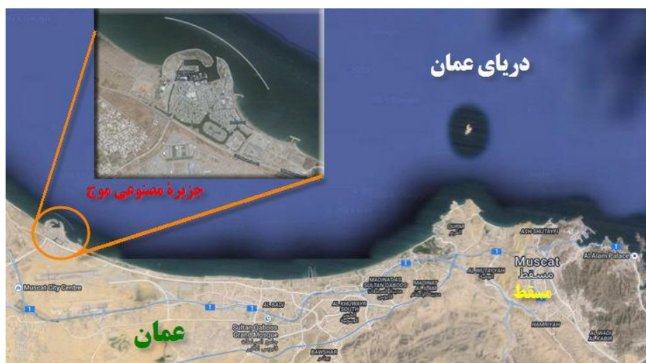
نقشه (۶): جزیره مصنوعی موج عمان، (عابدی‌درچه و براتی، ۱۳۹۳)

پروژه موجی شکل ۸۰۵ میلیون دلاری عمان، ۷/۳ کیلومتر از نوار ساحل و نزدیک ساحل این کشور را اشغال می‌کند. همچنین جزیره موج عمان، ۴۰۰۰۰۰ متر مربع از اراضی احیا شده را دربر می‌گیرد (پیشگاهی‌فرد و همکاران، ۱۳۹۱). جزیره مصنوعی موج