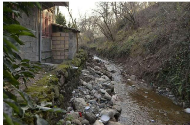
شکل (۲): وضعیت کیفیت آب نهر در پائین دست پرده‌سر دوهزار تنکابن

مدیریت مواد زائد جامد یکی از مشکلات عمده پیش روی برنامه ریزان شهری در سراسر جهان است، این مشکل در کشورهای در حال توسعه شدیدتر بوده و در این کشورها برنامه ریزی ضعیف و فقدان منابع مالی منجر به شیوه‌های ضعیف مدیریت مواد زائد جامد مانند جمع‌آوری آنها در مناطق پست مانند حاشیه جاده‌ها و زمین‌های کشاورزی و مراتع و یا تخلیه مستقیم به رودخانه‌ها و مسیل‌ها می‌شود (Kuo et al., 2002).