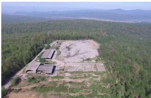
شکل (۱): محل مدفن زباله شهری تنکابن در استان مازندران در

پرده‌سر دوهزار (عکس برگرفته شده از سایت: