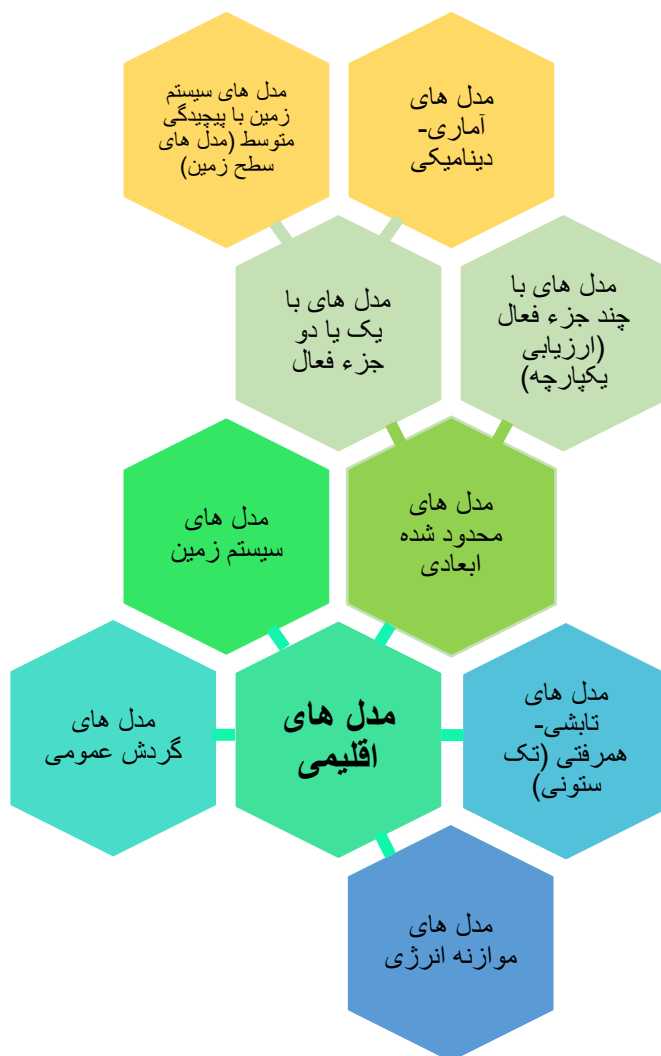
نمودار (۲): دسته بندی مدل‌های اقلیمی

مشاهده می‌شود، بر اساس نتایج این پژوهش، به طور کلی پنج گروه اصلی برای مدل‌های پیش‌بینی تغییرات اقلیمی می‌توان در نظر گرفت: ۱. مدل‌های موازنه انرژی (۴) ، ۲. مدل‌های تابشی-