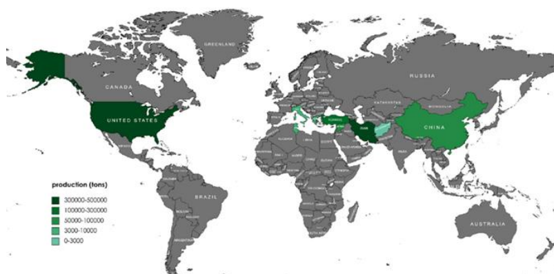
شکل (۱): نقشه پراکنش کشورهای برتر تولیدکننده پسته جهان در سال ۲۰۱۹ (Tridge, 2021)

داخلی ایران بهره برد (Pai et al., 2022a). در بخش نهایی مقاله، ایده‌ای نوین برای توسعه بیشتر این حوزه و بهبود فرایند تجاری‌سازی محصولات حاصل از پوست پسته ارائه خواهد شد. این ایده بر اساس تحلیل شکاف‌های موجود در مطالعات فعلی و بررسی چالش‌های اقتصادی و محیط‌زیستی مرتبط با فراوری و استفاده از پسماندهای کشاورزی شکل خواهد گرفت.